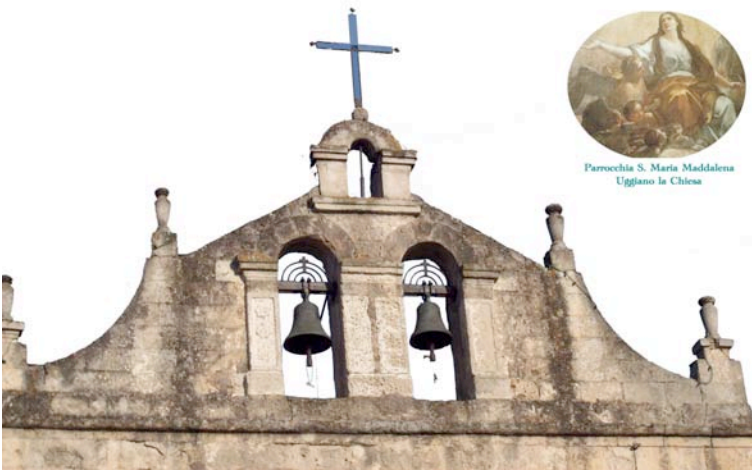
Parrocchia S. Maria Maddalena Uggiano la Chiesa