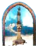
31 - chiesa di Santa Maria degli Angeli dei Frati Cappuccini Comune e Pro Loco di Scorrano, www.scorranoweb.it info 0836 460237 - 338 1024359