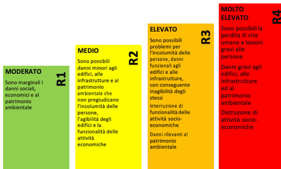
Figura 1 - Rischio idrogeologico. Classi di rischio (cfr. Direttiva PCM 29/09/1998).

La Direttiva Europea 2007/60/CE (Direttiva Alluvioni) , recepita in Italia dal decreto legislativo 49/2010 e SS.mm.ii., istituisce "un quadro per la valutazione e la gestione dei rischi di alluvioni, volto a ridurre le conseguenze negative per la salute umana, l'ambiente, il patrimonio culturale e le attività economiche connesse con le alluvioni all'interno della Comunità". In tale contesto si inserisce il Piano di Gestione del Rischio di Alluvioni che, sulla base delle mappe di pericolosità e rischio, analizza gli aspetti legati alla gestione delle alluvioni, quali la prevenzione, la protezione, la preparazione ed il recupero post- evento.